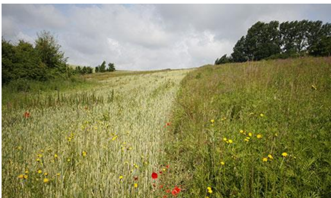
Voorbeeld van een natuurakker.

De Zunasche Heide is één van de weinige plekken waar de droge heide direct grenst aan de omliggende cultuurgrond. Daarnaast was de Zunasche Heide vroeger als nat heidegebied een belangrijk onderdeel van dit ecosysteem. Daardoor heeft dit gebied de meeste potentie voor het herstel van het heide-ecosysteem met een afwisseling van hoge droge en lagere nattere gronden. Als de werkzaamheden zijn uitgevoerd zorgt aangepast heide- en akkerbeheer dat de maatregelen ook blijvend effect hebben.