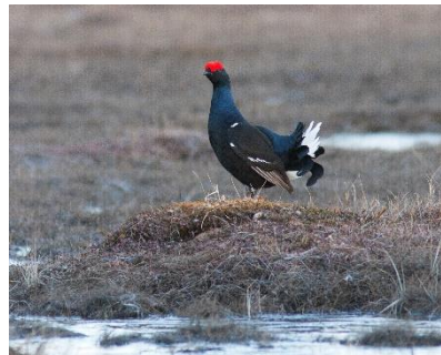
Kenmerkende heidevogelsoorten zijn wulp, grutto, patrijs, fazant (foto links) en korhoen (foto rechts).